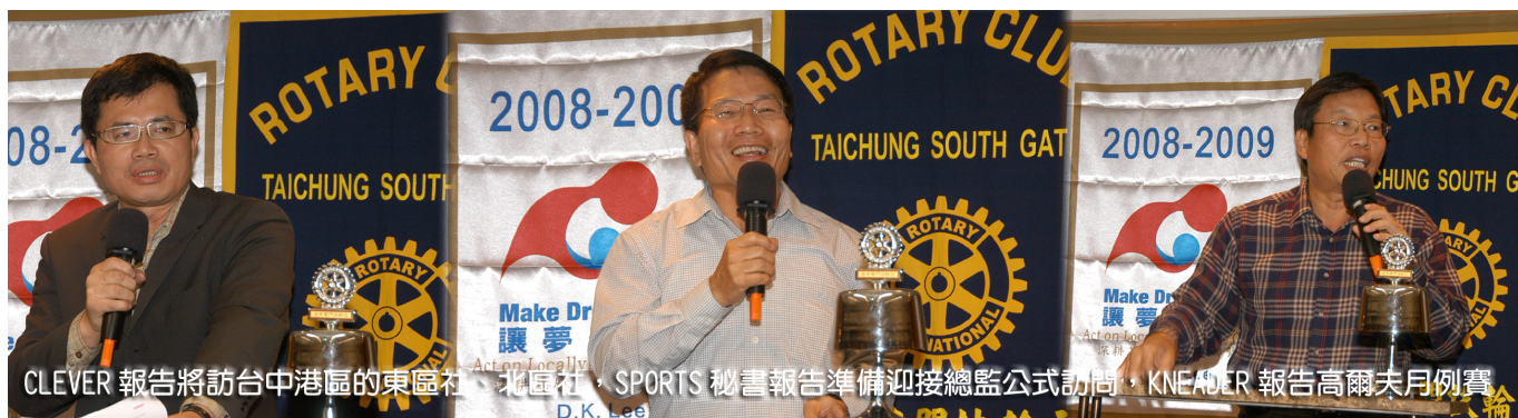
CLEVER 報告將訪台中港區的東區社、北區社，SPORTS 秘書報告準備迎接總監公式訪問，KNEADER 報告高爾夫月例賽

CLEVER 報告下週將開始訪問台中港區的東區社、北區社，敘述沙鹿有名的圓仔、清水的米糕，會帶大家去品嚐老滋味。KNEADER 報告高爾夫月例賽，週四在霧峰球場舉行。