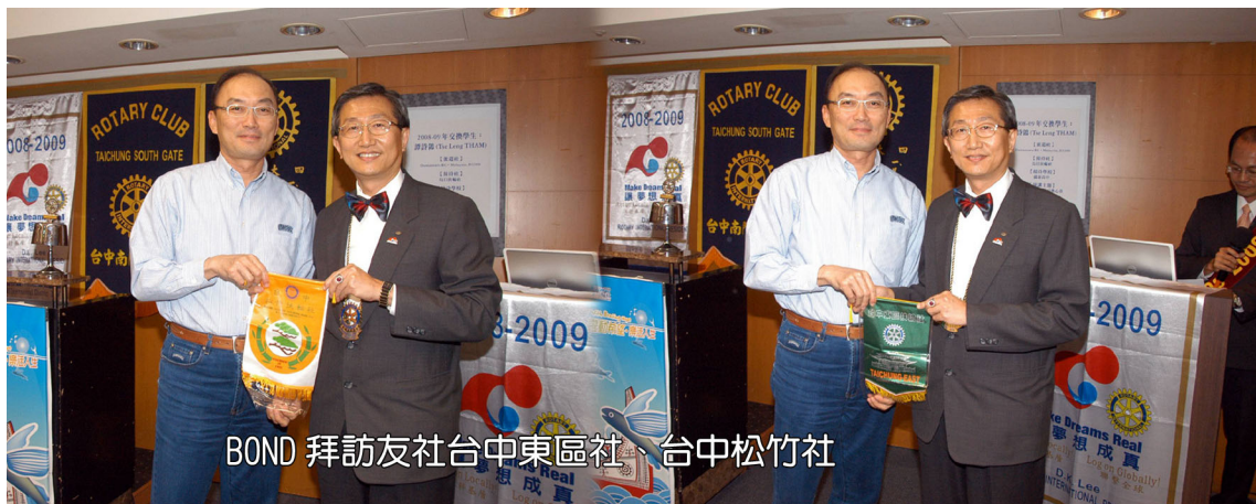
BOND 拜訪友社台中東區社、台中松竹社

SPORTS 秘書報告，職業楷模表揚 5 月 5 日截止推薦、5 月 12 日進行審核，請社友踴躍提出