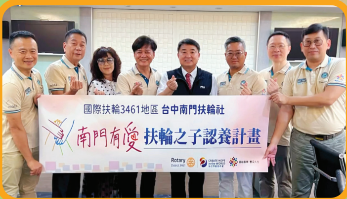
台中二中 扶輪之子捐贈活動