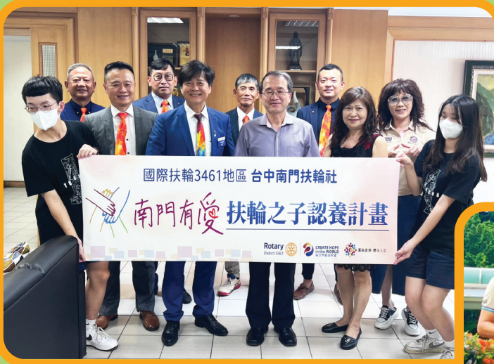
台中家商 扶輪之子捐贈活動