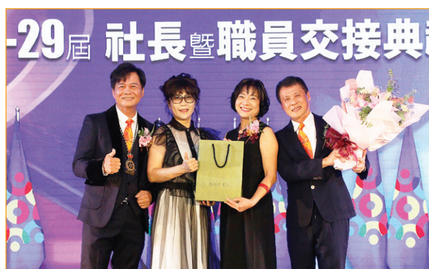
▲致贈卸任社長、社長夫人紀念品