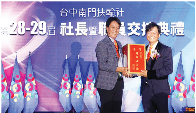
▲ 新店碧潭社致贈社長禮品