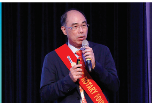
扶輪基金委員會 主委 / Suger 報告