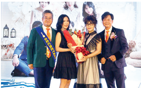
▲ Sugeon 秘書伉儷致贈社長伉儷花束