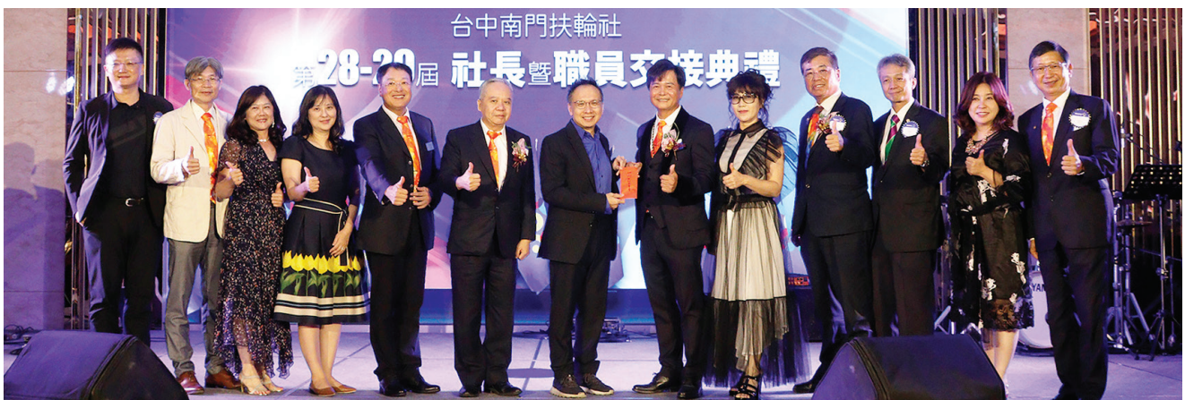
▲ 18-19 社祕致贈社長就職祝賀紅包