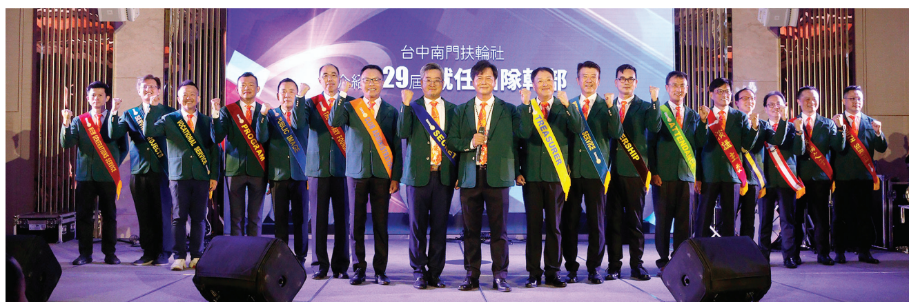
▲ 29 屆團隊接棒，繼續為大家服務