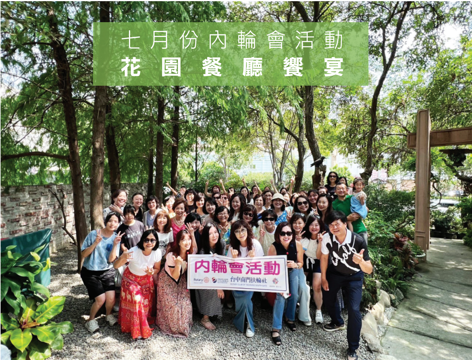
第 29 屆內輪正式轉動～台中網紅餐廳 Mooie Garden | 2023.7.15