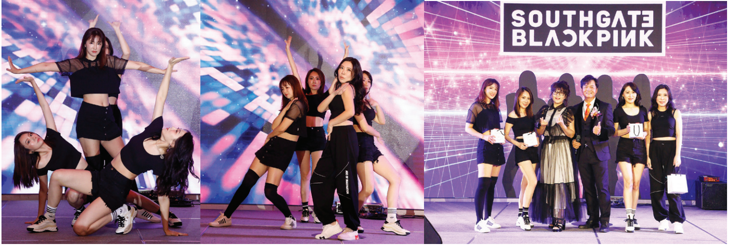
▲南門女子天團舞蹈表演 Blackpink (Surgeon 夫人、Sugar 夫人、Casting 夫人、Handsome 夫人)