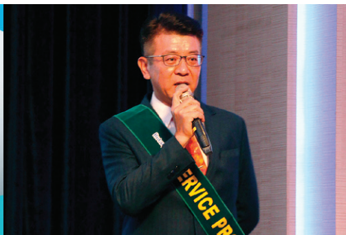
服務計畫委員會 主委 / Hope 報告