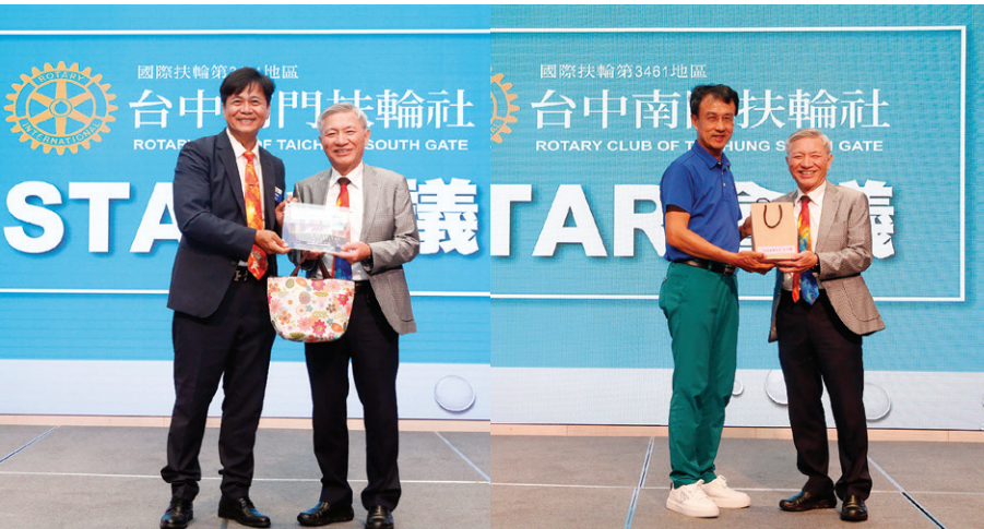
Poster 社長及 STAR 主委致贈 CP Concept 紀念品