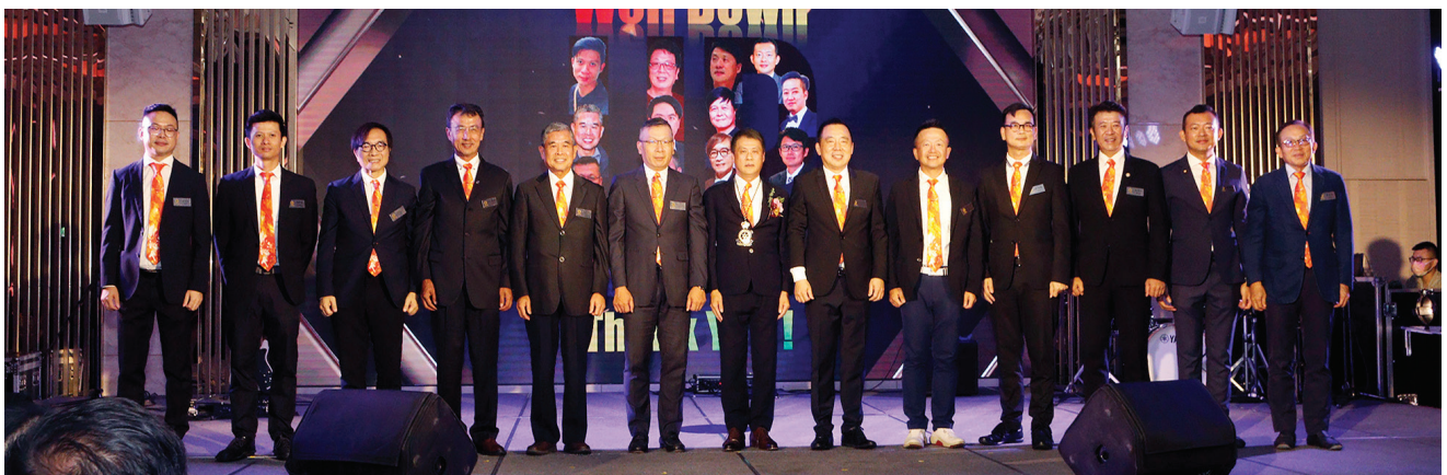
▲感謝28屆團隊一年來為社務的奉獻

感謝所有 28 屆辛苦的團隊幹部們盡心盡力，一起辦好各項服務及大小型活動，再次感謝所有社友及夫人的參與。