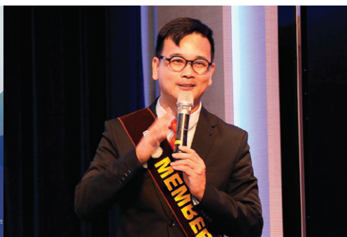
社員委員會 主委 / Polo 報告