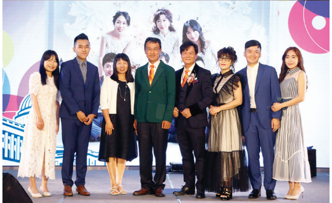
▲ Rich PP 介紹就任社長 Poster 家庭