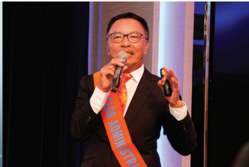
社務行政管理委員 主委 / Biotek 報告