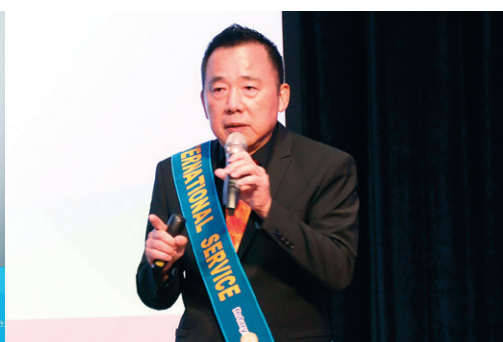
公共形象委員會 主委 / Bioter 報告