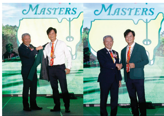
▲ CP Concept 為熱愛高爾夫球的 Poster 社長披上代表卓越、成就、傳統和勝利的高爾夫綠夾克

我們 29 屆團隊，已經準備好了，希望未來的一年可以給大家帶來精彩、快樂的一年，正如同我們 29 屆的口號「圓融喜樂 豐采人生」。