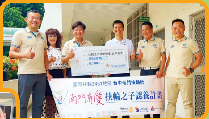
台中高工 扶輪之子捐贈活動