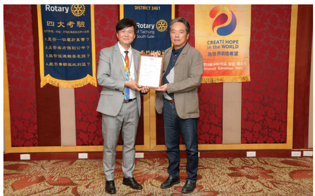
頒發捐贈台中市智障者家長協會運動服感謝狀