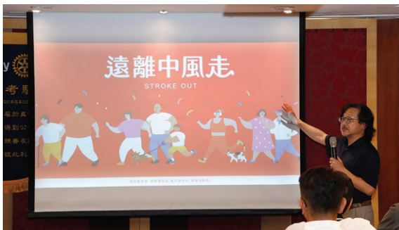
台灣腦中風協會創會理事長 Brins 介紹「遠離中風走」公益活動內容