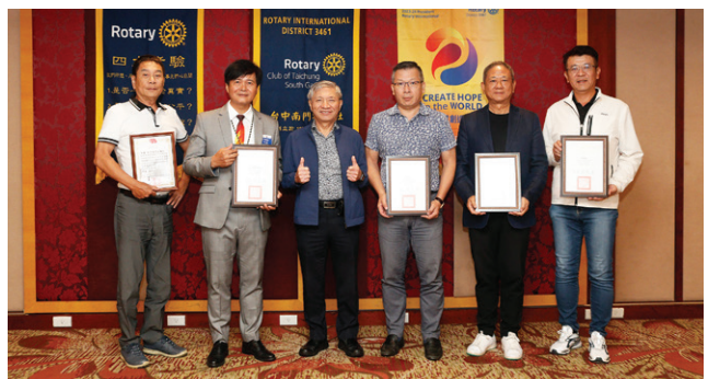
頒發三愛合一感謝狀，感謝 Hope、Faith、Poster、Star、Archi 熱心公益