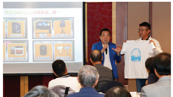
扶輪日招商主委 Bistro 介紹扶輪日當天流程、摸彩獎項、扶輪日 T 恤，也廣邀知名的廠商，相信這次的活動會非常熱鬧，誠摯的歡迎社友及夫人、小扶輪一起參加。