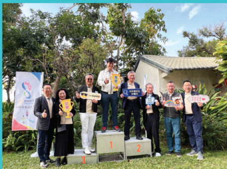
▲參加台中馬拉松社社慶