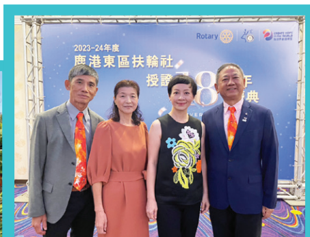
▲參加鹿港東區社社慶