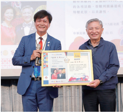
授證特別顧問 出席小組長 CP Concept