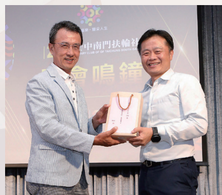
出席主委 Rich 致贈出席副主委 Life 禮品