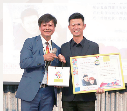
RYE 主委 Yummy