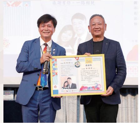
服務計劃主委 Hope (由 Archi 代理領獎)