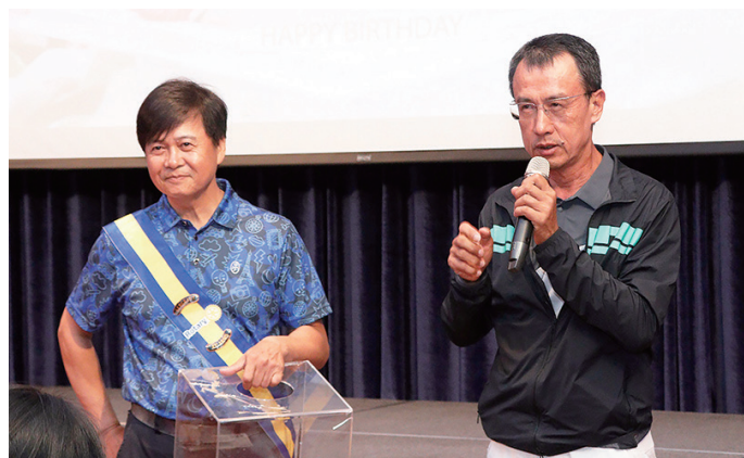
Poster IPP 代理主持糾察時間