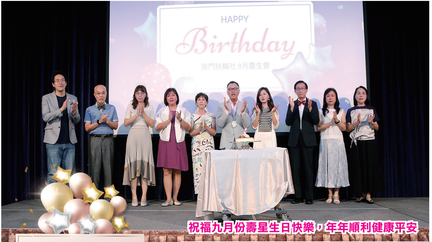
祝福九月份壽星生日快樂，年年順利健康平安