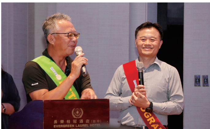
出席主委 Melon 報告今日出席率 64%