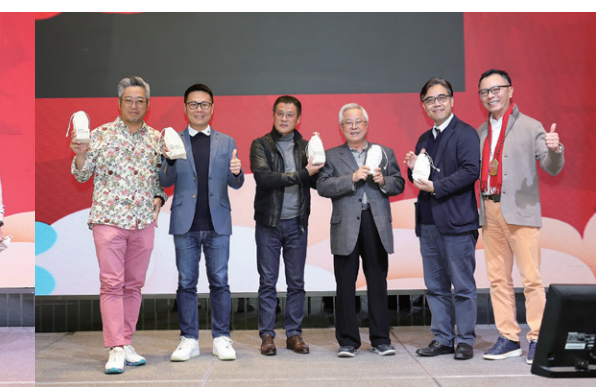
出席率達 92%，社長頒發出席獎