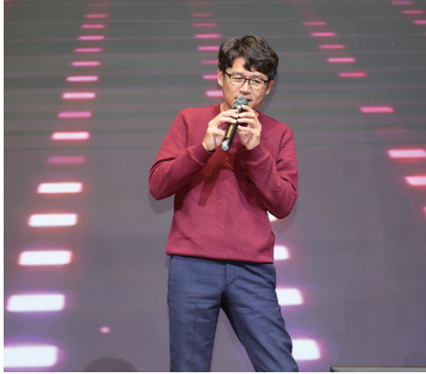
King / 弄獅