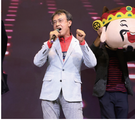
Rich / 歡喜就好