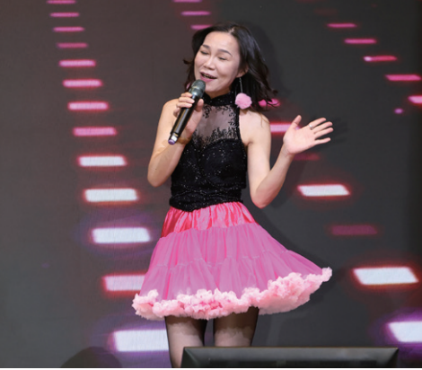
Elon 夫人 / 保庇