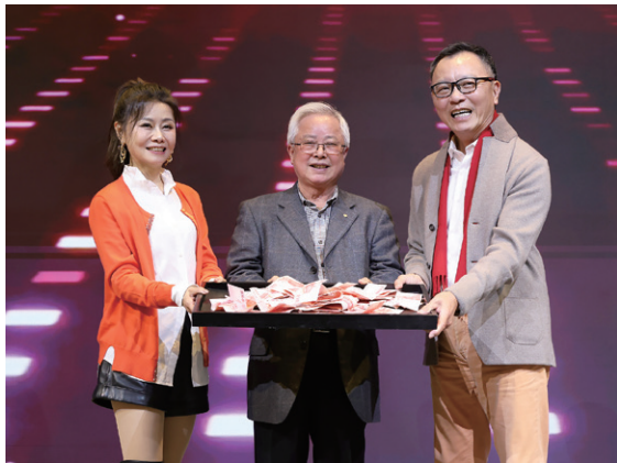
電話 Call in 大贏家