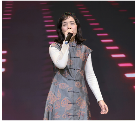
Iron 夫人 / 迎春花