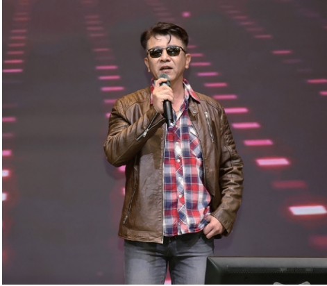
Hope / 好運總來