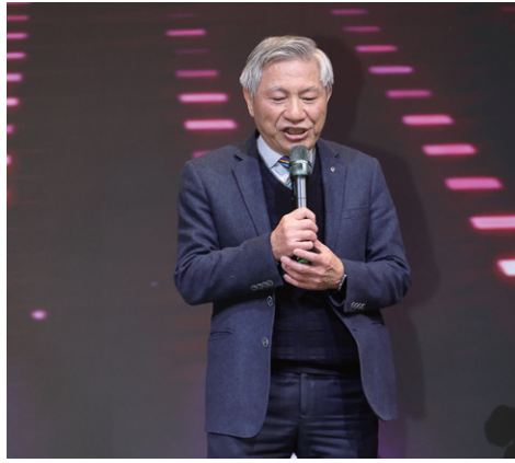
CP Concept / 廟會