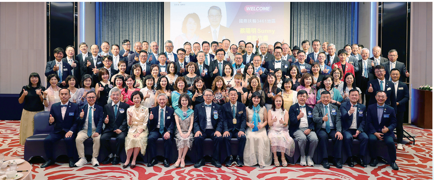
總監公式訪問圓滿順利，不僅凝聚本社の向心力，更為新年度注入前行的力量