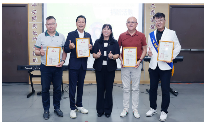
捐贈儀式～捐贈惠明教養院院生生活設備老舊汰換經費，南門社經費與社友捐款共60萬元