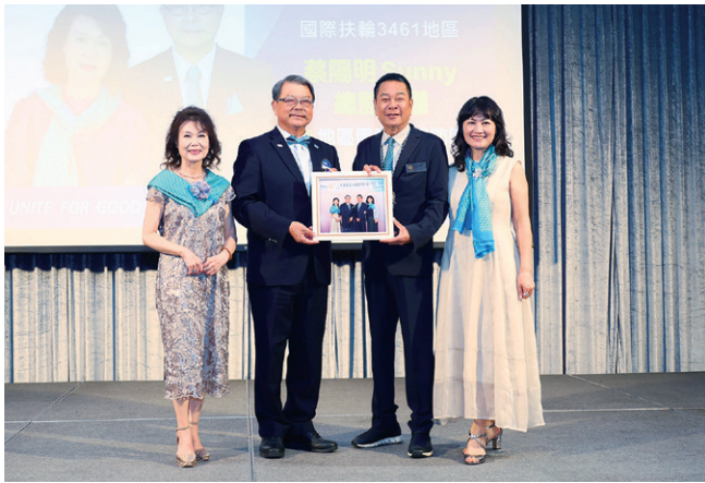
總監致贈社長伉儷紀念品