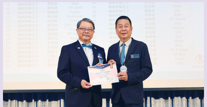
頒發捐助扶輪之子計劃感謝狀由社長代表授獎