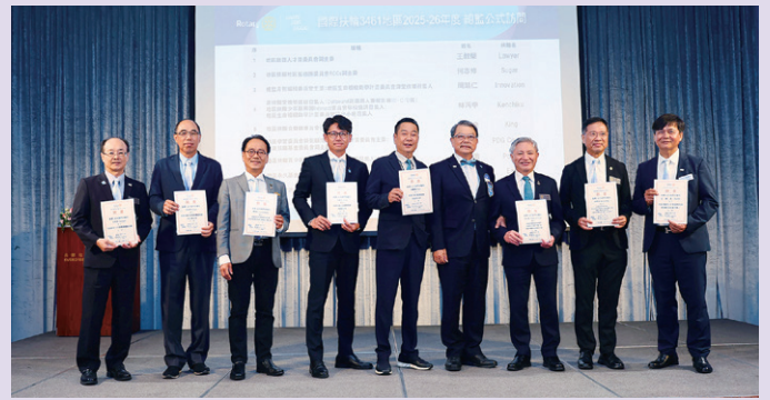
頒發擔任地區職務聘書