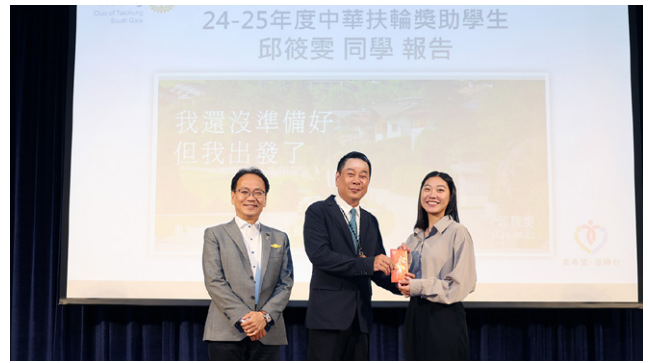
中華扶輪獎學生推薦人 Innovation 頒發捐助獎學金 20,000 元