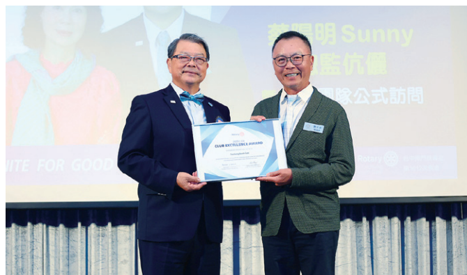
台中南門社榮獲 2024-25 年度社卓越獎，30 屆社長 Bistro 代表授獎