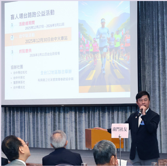
總監團隊佈達今年地區各項活動