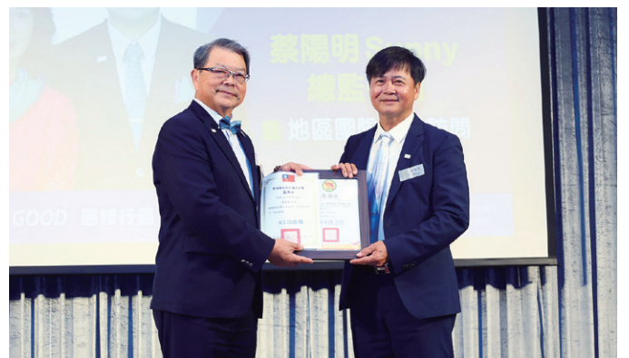
感謝 PP Poster 透過扶輪公益網慷慨捐贈偏鄉學校筆記本一大批