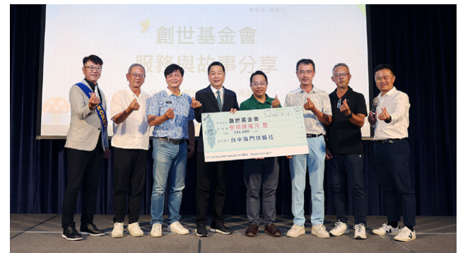
連續六年捐助「創世基金會台中清寒植物人安養院」南門社經費與社友捐款共 34 萬元