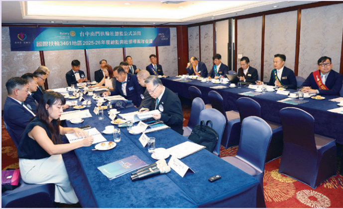
總監與社領導團隊會議