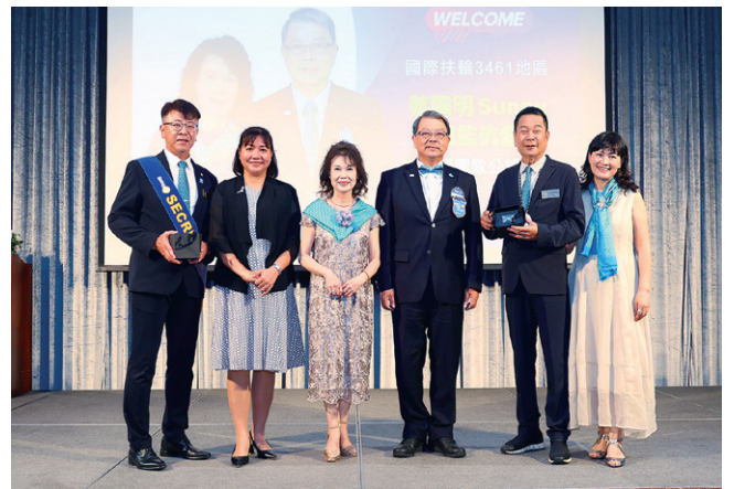
總監致贈社長、秘書紀念品