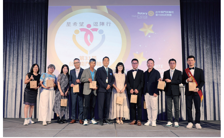
出席主委 Elon 報告本次例會出席率達 96%，頒發出席獎