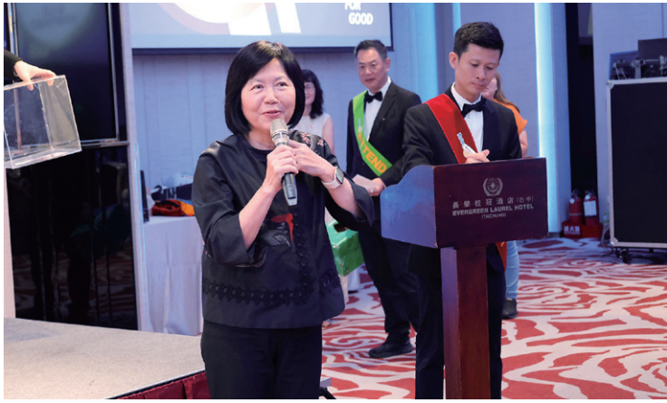
PDG Eyes 於糾察時間獻上祝福，祝福 Star 帶領的團隊社運昌隆。