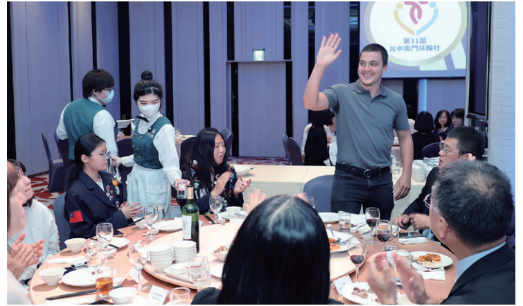
聯誼主委 Handsome 介紹來賓