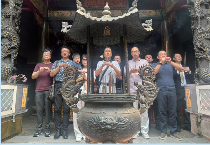
114.7.1 第 31 屆社長 Star 帶領團隊至台中城隍廟 上香祈福社運昌隆