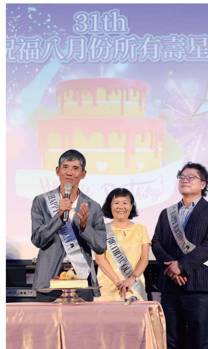
八月壽星大集合！生日快樂～願大家每天都幸福加倍、好運連連！社長也準備了禮物送上滿滿心意！