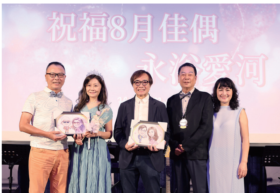
恭喜八月份結婚的社友伉儷！祝福甜蜜滿分、幸福久久～