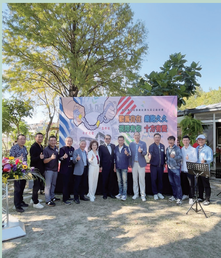
參加馬拉松扶輪社 第九屆公益社慶