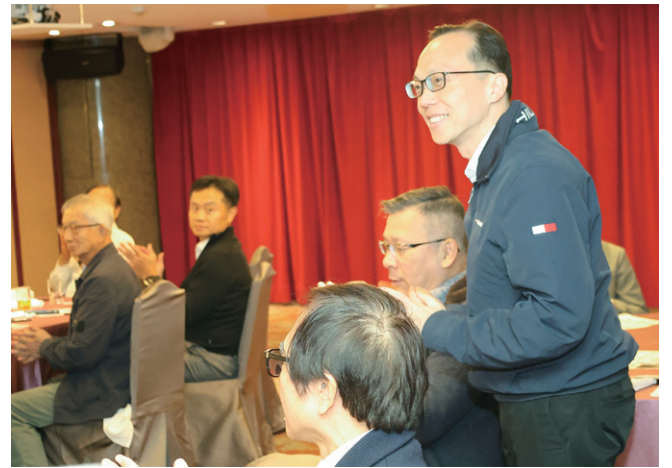
「阿里山福森號秋遊」圓滿成功，特別感謝 Handsome 伉儷用心規劃與細心安排，讓整個行程順暢愉快，留下美好回憶。