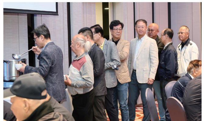
Casting 伉儷喜迎第三胎小王子，CP Concept 熱情贊助彌月雞酒，與大家一同分享這份新生命的喜悅。