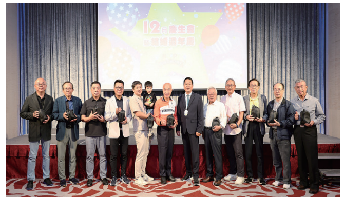
恭喜 11 位社友抽中扶輪日頸枕